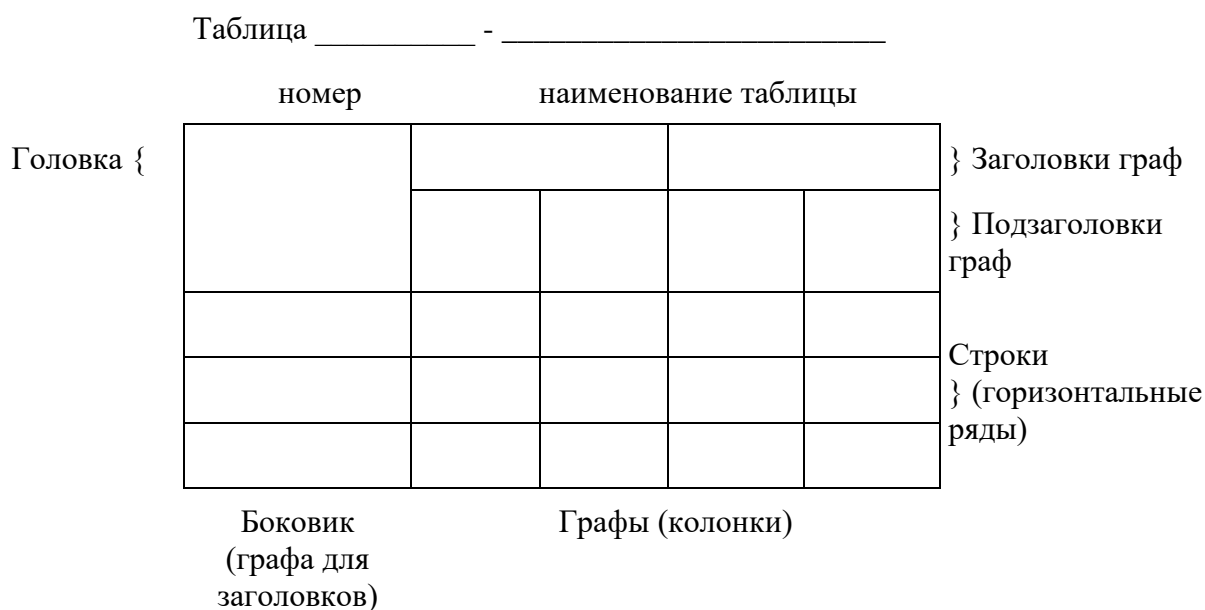
Рисунок 1 - Оформление таблиц

Таблицы слева, справа, сверху и снизу ограничивают линиями. Разделять заголовки и подзаголовки боковика и граф диагональными линиями не допускается. Заголовки граф выравнивают по центру, а заголовки строк - по левому краю.