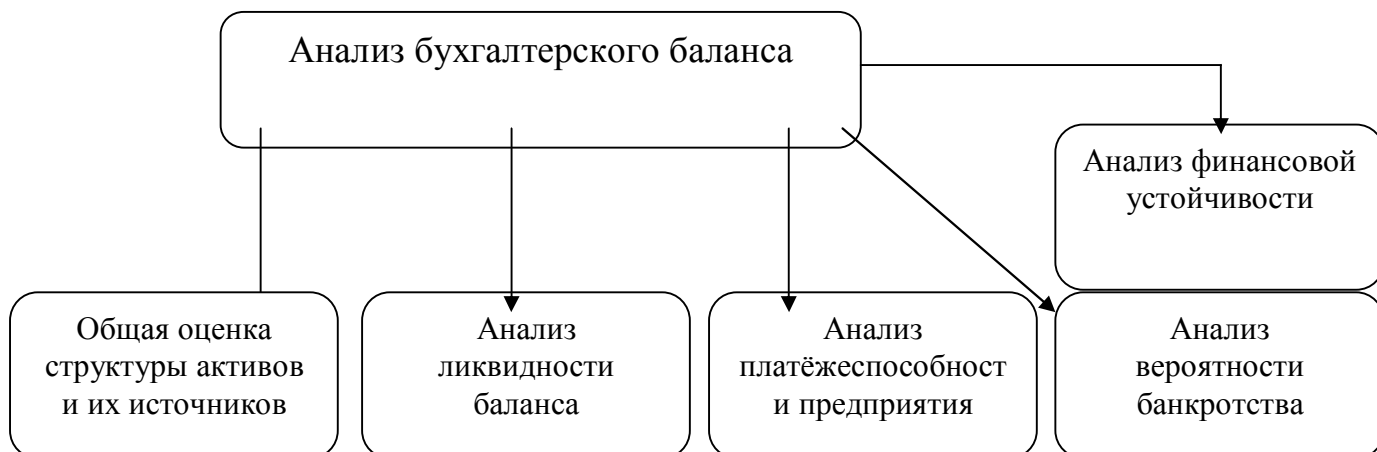
Рисунок 1. Этапы анализа бухгалтерского баланса

Последовательность анализа бухгалтерского баланса можно представить следующим образом (рис. 1):