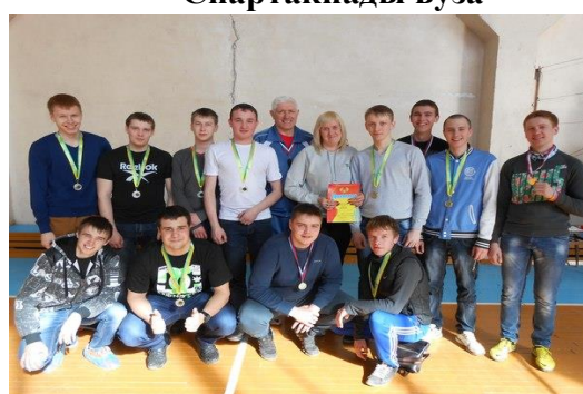
Команда факультета по волейболу- чемпионы и призеры Спартакиады