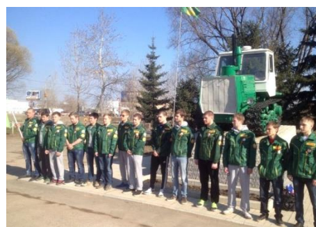
Механизированный отряд студентов перед практикой

СТУДЕНТЫ НА ВЫЕЗДНЫХ ЗАНЯТИЯХ И ПРОИЗВОДСТВЕННЫХ ПРАКТИКАХ, В СТУДЕНЧЕСКИХ ОТРЯДАХ И НА РАЗЛИЧНЫХ МЕРОПРИЯТИЯХ