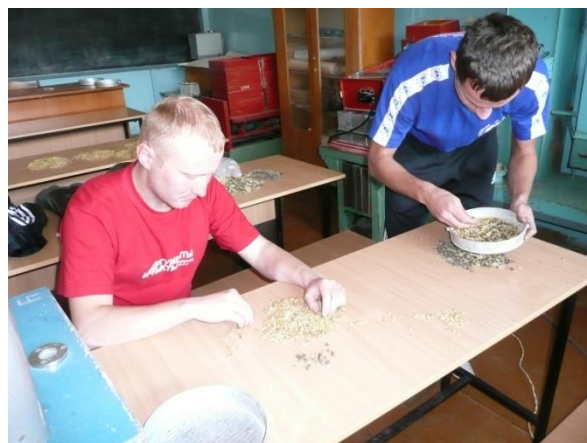
Аспиранты оценивают работу зерноочистительной машины