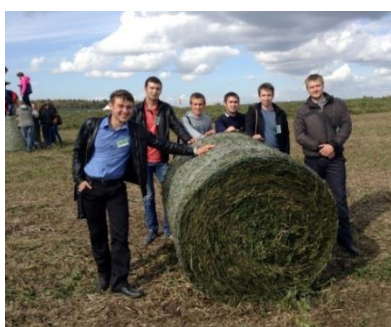
На испытательном полигоне ООО Навигатор-НМ, с. Платошино