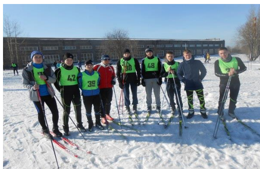
Команда факультета по лыжным гонкам- многократные чемпионы Спартакиады вуза