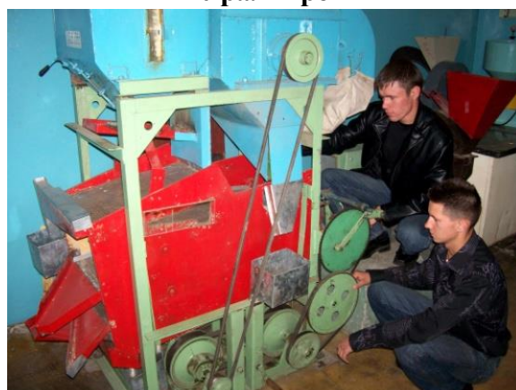
Студенты готовят к работе спроектированную и изготовленную воздушно-решетную машину

НАУЧНО-ИССЛЕДОВАТЕЛЬСКАЯ РАБОТА СТУДЕНТОВ, МАГИСТРАНТОВ И АСПИРАНТОВ