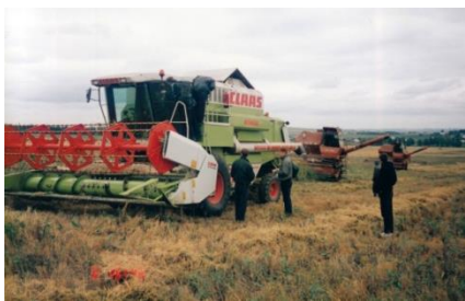
Студенты на испытаниях комбайнов