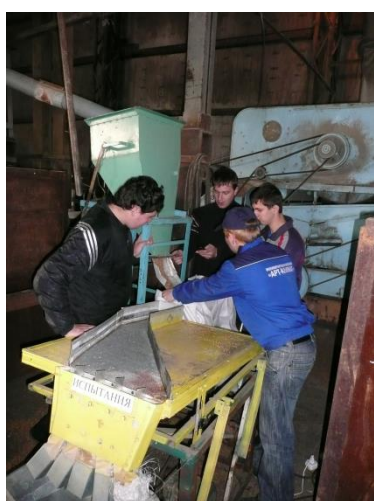
Аспиранты и студенты готовят к производственным испытаниям вибропневмосепаратор