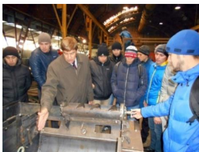
В цехе ООО «Техноград»