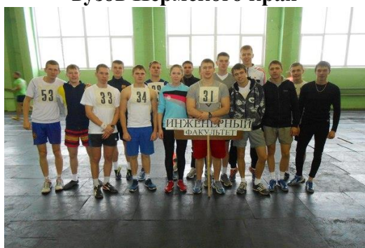
Команда факультета по легкой атлетике - чемпионы вуза