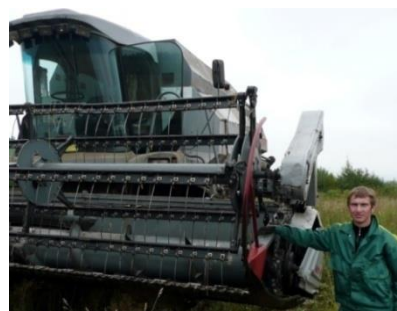
В ООО «Русь» Пермского района