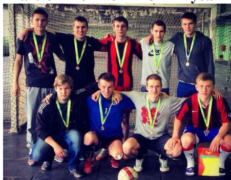
Команда факультета по мини-футболу – многократные призеры Спартакиады