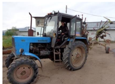
На практике в учхозе