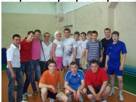
Команда факультета по волейболу