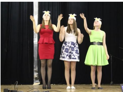
СТУДЕНТЫ НА КОНКУРСАХ «АЛЛО, МЫ ИЩЕМ ТАЛАНТЫ», «СТУДЕНЧЕСКАЯ ВЕСНА»