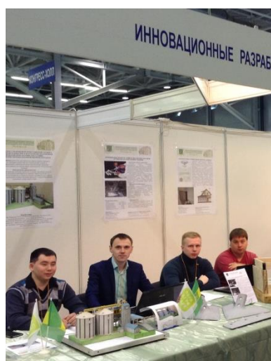
Магистранты и аспиранты рекламируют разработки на региональной выставке УралАгро