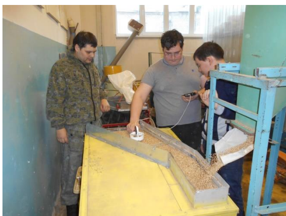
Магистранты проводят настройку усовершенствованного вибропневмосепаратора