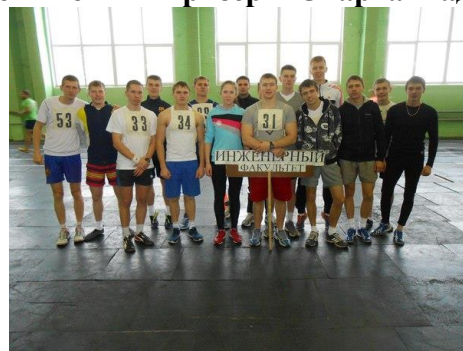
Команда факультета по легкой атлетике