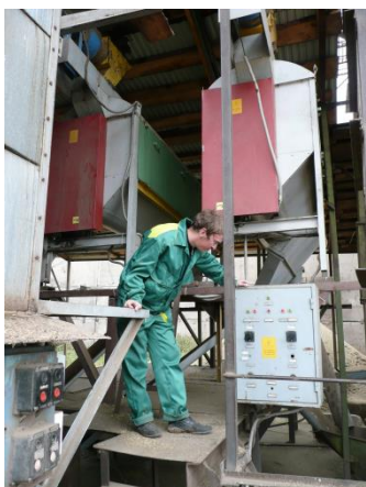
Оценка качества работы оборудования в ООО «Русь» Пермского района