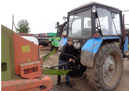
Подготовка агрегата к работе