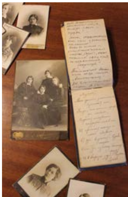
БУДЬ ВСЕГДА ВЕРНА САМОЙ СЕБЕ, И НИ ЖЕЛАЙ ЛЮДЯМ ТОГО, ЧЕГО НЕ ЖЕЛАЕШЬ СЕБЕ.