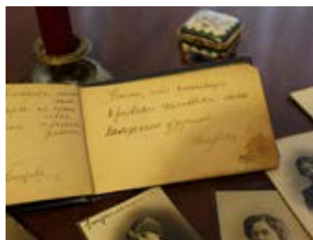
«ПОМНИ, ЧТО НАСТОЯЩЕЕ ПРИЗВАНИЕ ЧЕЛОВЕКА БЫТЬ ПОЛЕЗНЫМ ДРУГИМ»

Пронизывающее сознание высказывания, не правда ли, заставляет задуматься, и ты, автоматически, проецируешь его на свою жизнь.