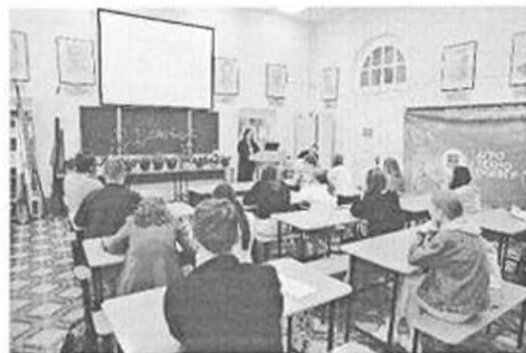
АгроНТРИ в Пермском ГАТУ