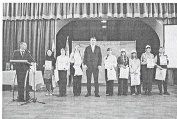
Награждение победителей конкурса «Время, вперед 2023»

2. С 1 по 10 апреля 2023 г. в Пермском ГАТУ проходил конкурс исследовательских работ и проектов «Время, вперед!» среди обучающихся общеобразовательных и профессиональных образовательных организаций. Конкурс проходил в рамках Всероссийского фестиваля «Дни молодежной науки в аграрном вузе», приуроченного к Десятилетию науки и технологий в России. На конкурс была подана 181 заявка на участие.