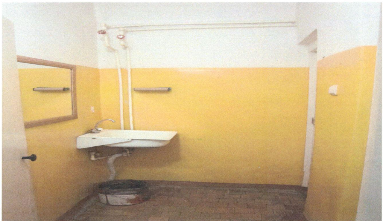
Фото 10. Санитарно-гигиеническое помещение (раковина)