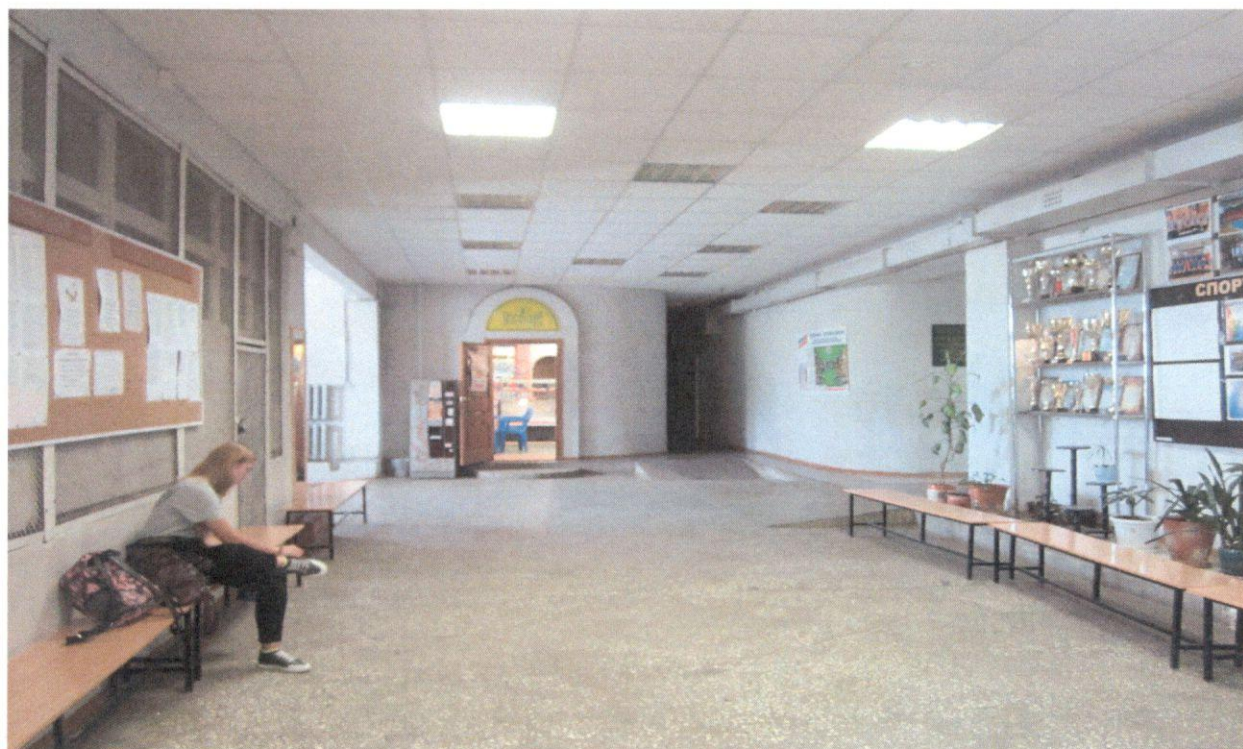
Фото 12. Вестибюль