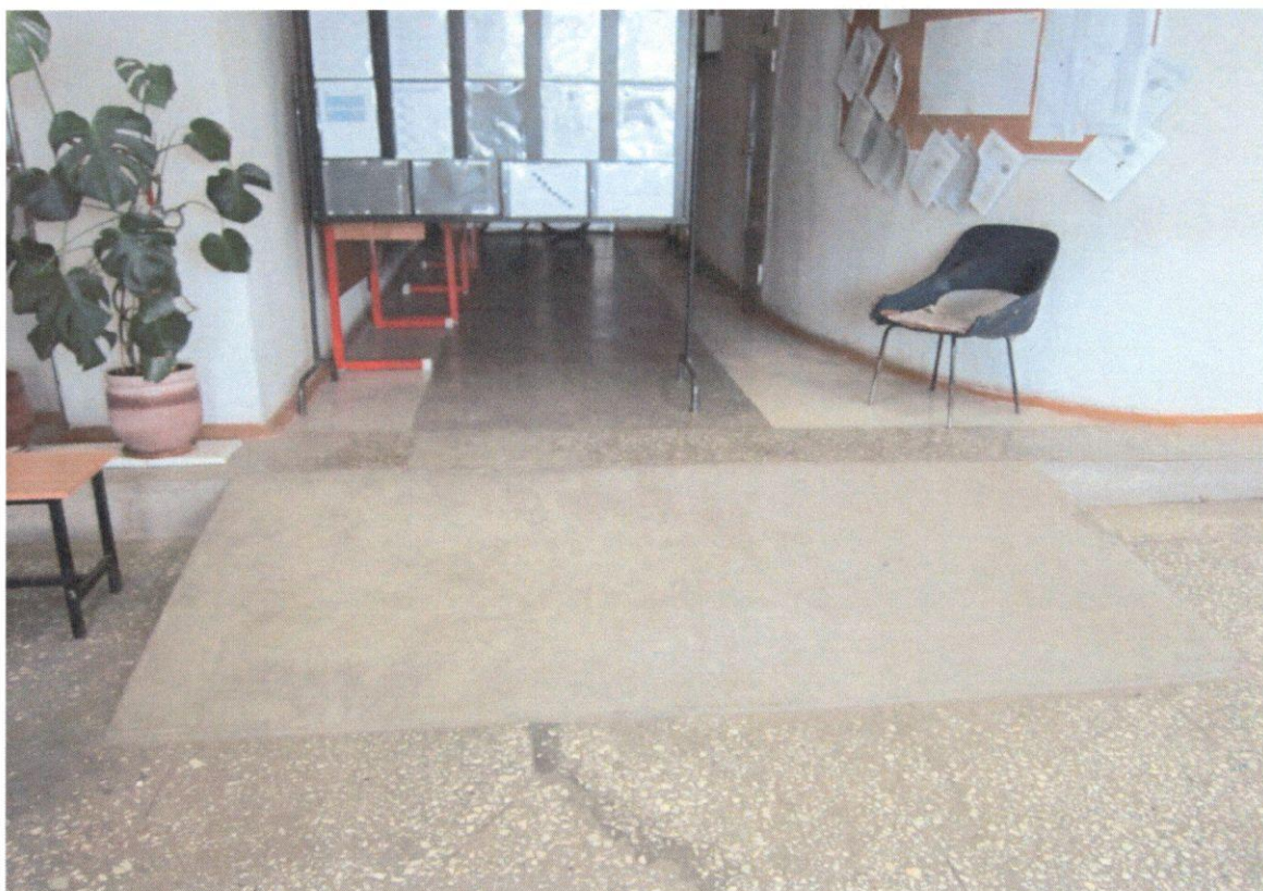
Фото 5. Пандус (внутри здания)