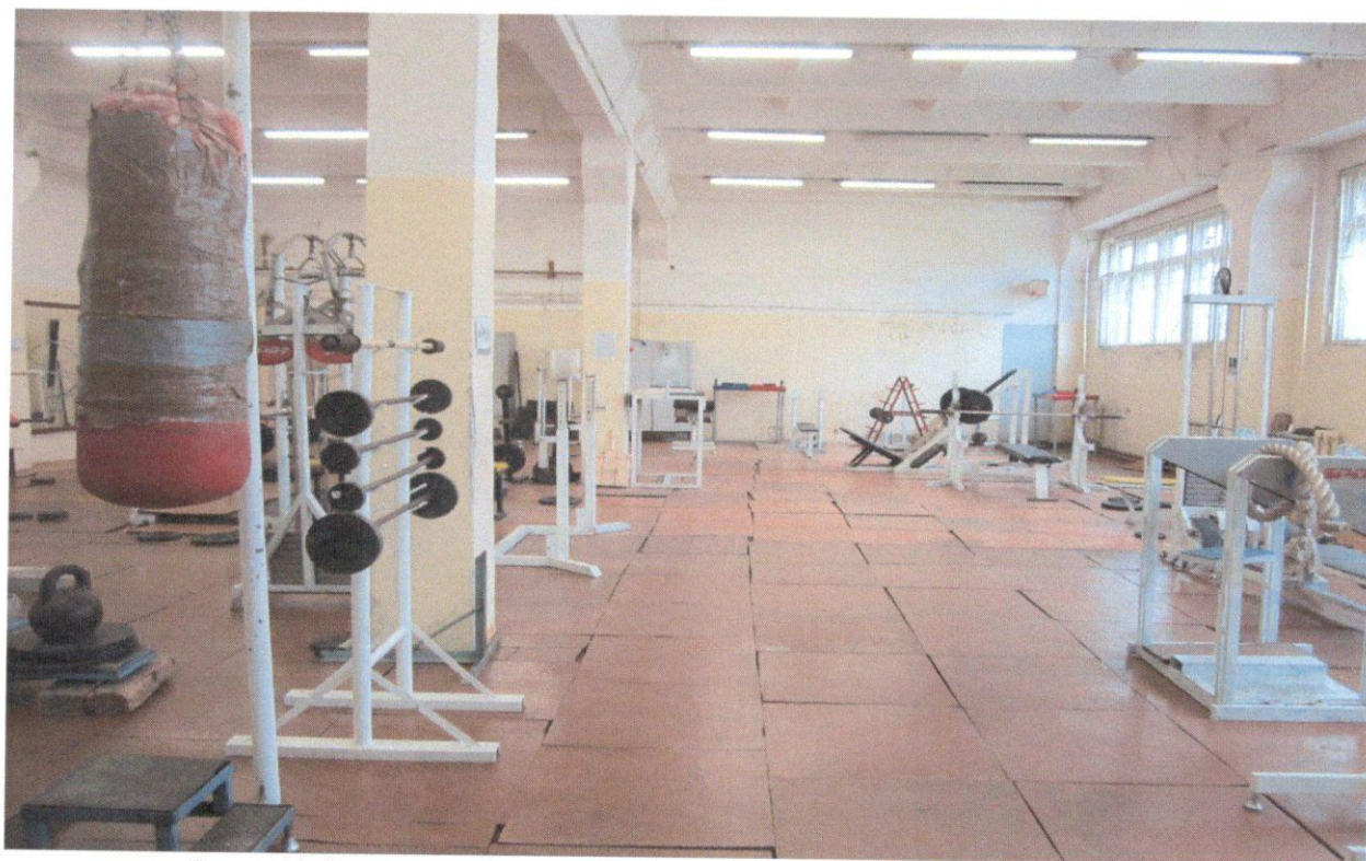
Фото 7. Зальная форма обслуживания (тренажерный зал)