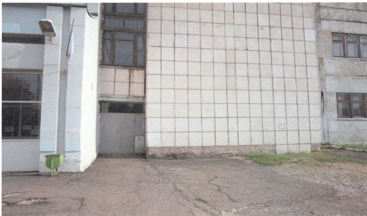
Фото 2. Автостоянка и парковка