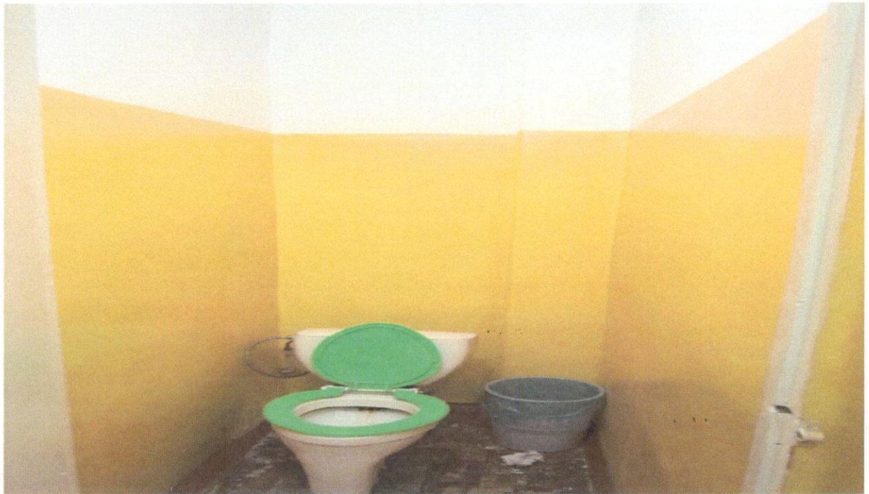
Фото 9. Санитарно-гигиеническое помещение (унитаз)