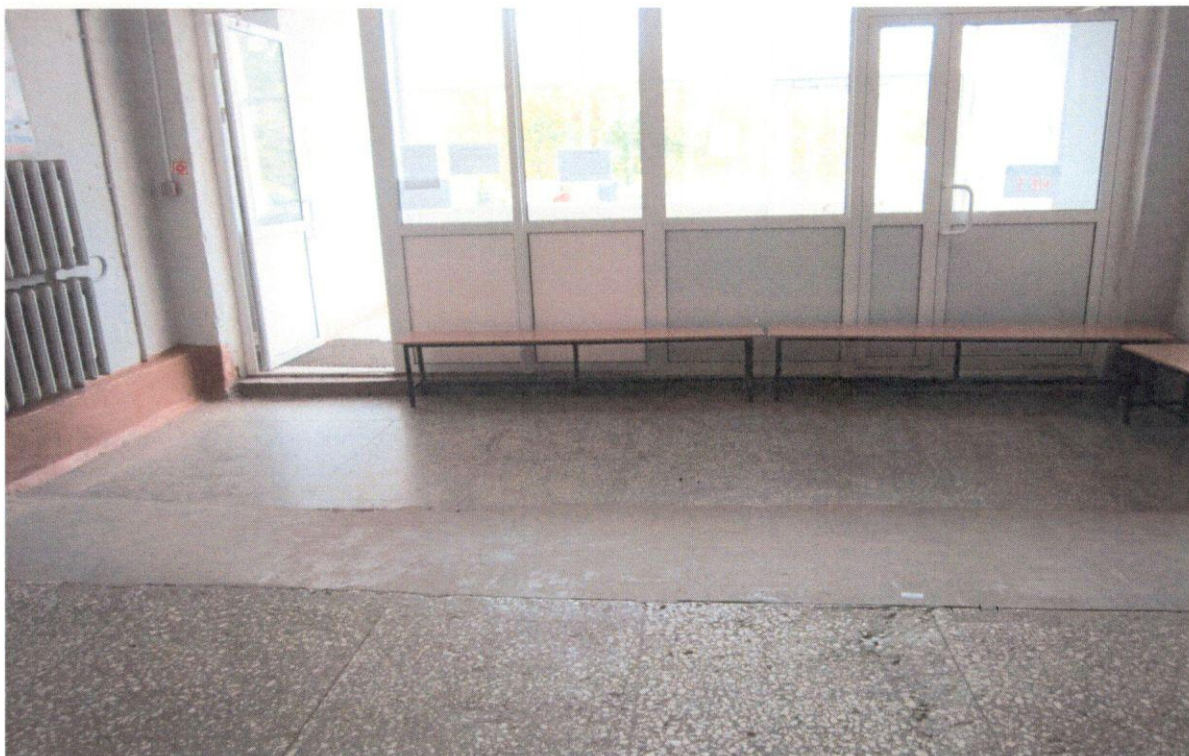
Фото 4. Пандус (внутри здания)