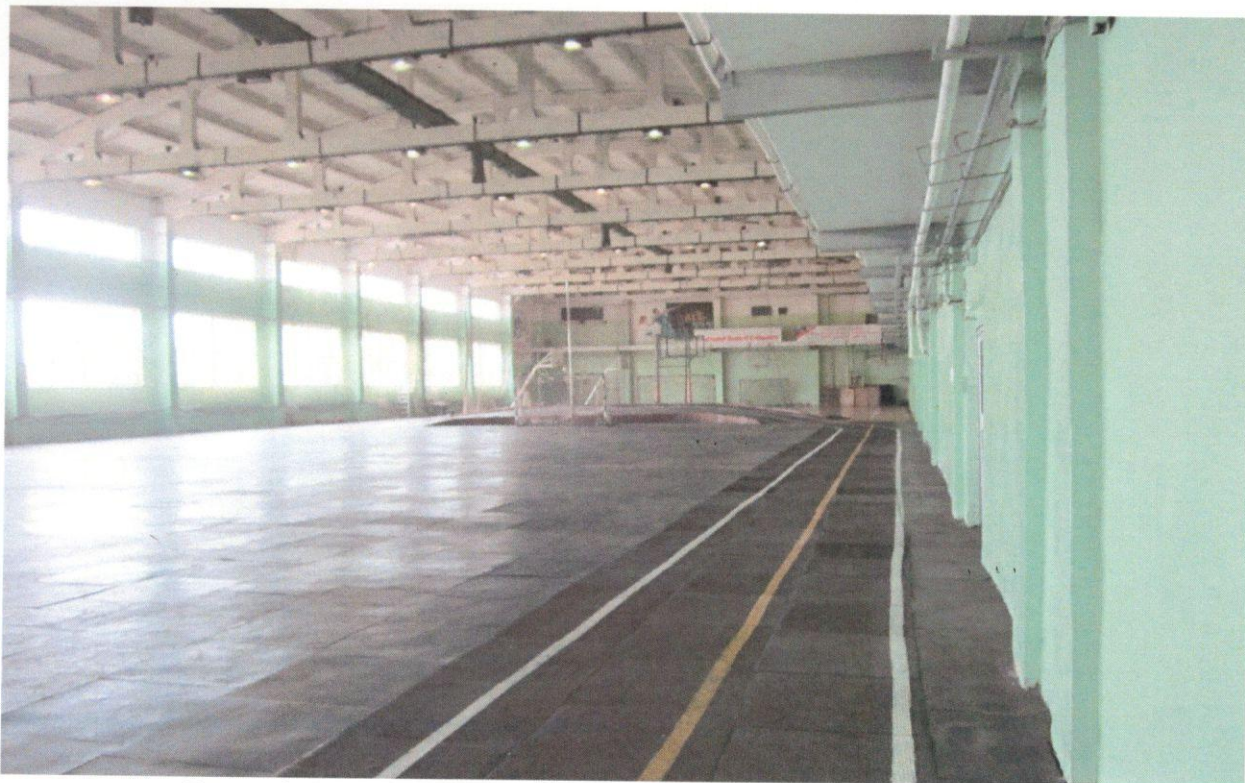
Фото 6. Зальная форма обслуживания (спортивный зал)