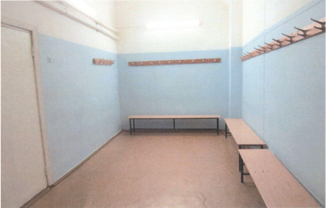
Фото 8. Кабина индивидуального обслуживания (раздевалка)