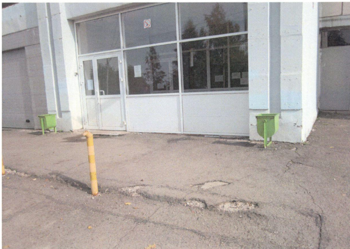
Фото 1. Путь (пути) движения на территории. Дверь (входная)