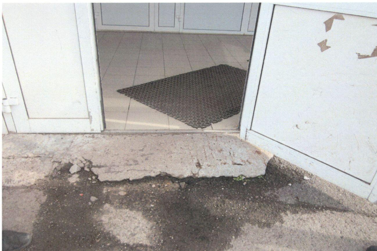
Фото 3. Входная площадка (входная дверь)